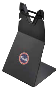
※写真はRSMになります。