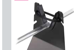
ステンレス製/ゴムリング付き