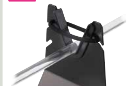
ステンレス製/ゴムリング付き